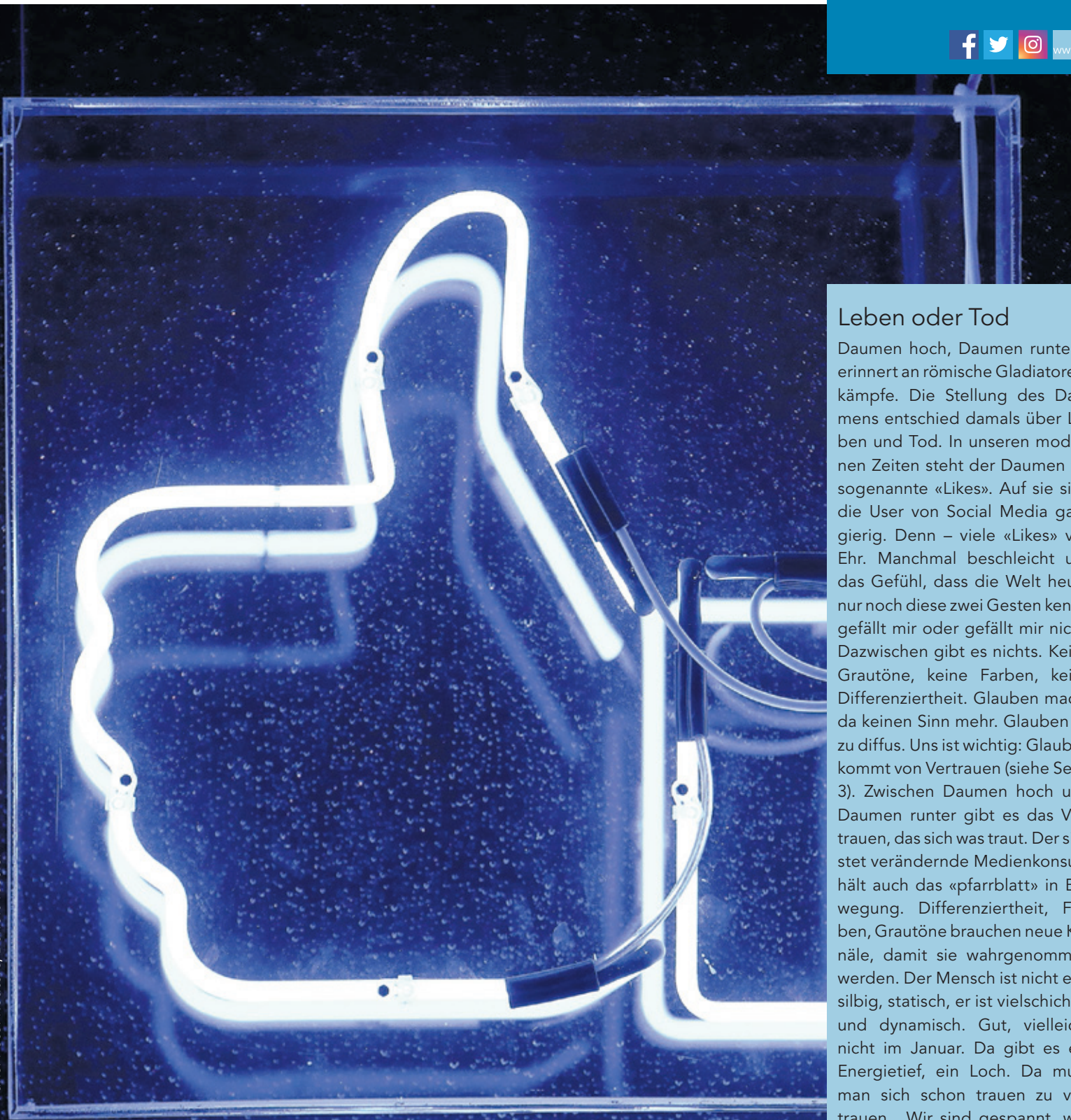
«Like-Button», Facebook-Zentrale in Paris.