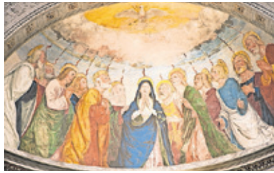
Pfingstszene, Sant'Anastasia-Kirche Verona.