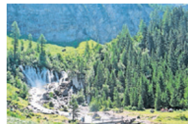
Das Ziel unserer Wanderung

Es wäre schön, wenn es ein Wie- dersehen draussen in der freien Natur gäbe, nach vielen Wochen des «physical distancing».