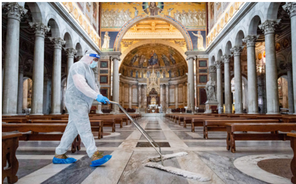
Desinfektion der Papstbasilika San Paolo fuori le Mura in Rom.