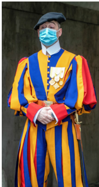
Schweizergardist am 18. Mai vor dem wiedereröffneten Petersdom im Vatikan.