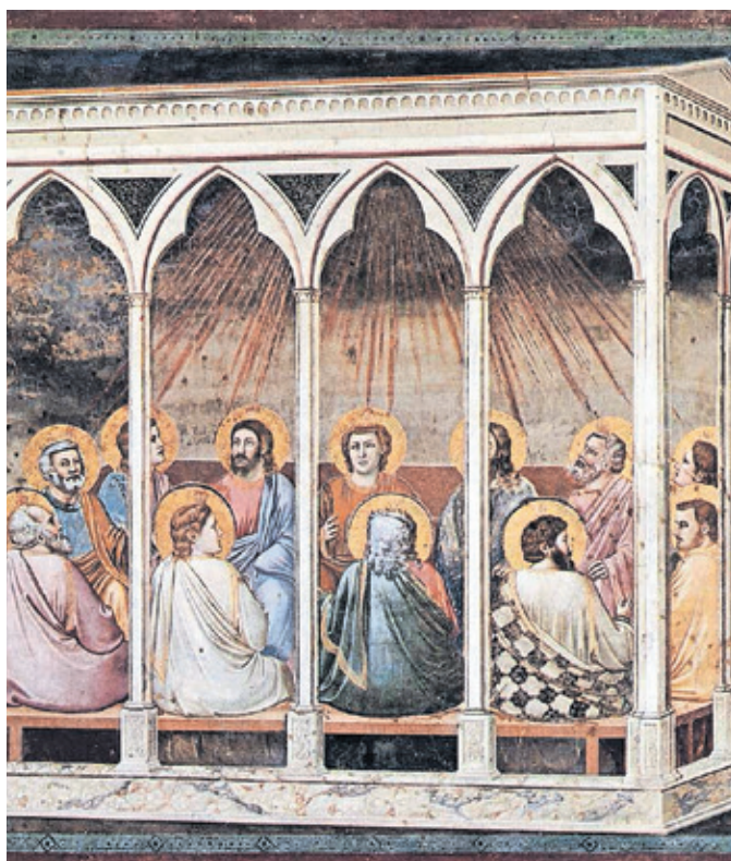
Giotto di Bondone, Pentecoste, Fresco um 1305, Scrovegni-Kapelle Padua, Italien.

An Pfingsten stellt sich die Frage besonders drängend: Was ist das eigentlich, diese Heilige-Geist-Kraft? Paulus und die ersten Gemeinden sind überzeugt: Wer getauft ist, hat diese Heilige-Geist-Kraft erhalten. Das hat spürbare Folgen: Denn die Geistkraft schenkt Begabungen und Fähigkeiten, die alle Getauften in der Gemeinde einsetzen sollen – egal ob Mann oder Frau, einheimisch oder fremd, versklavt oder frei geboren.