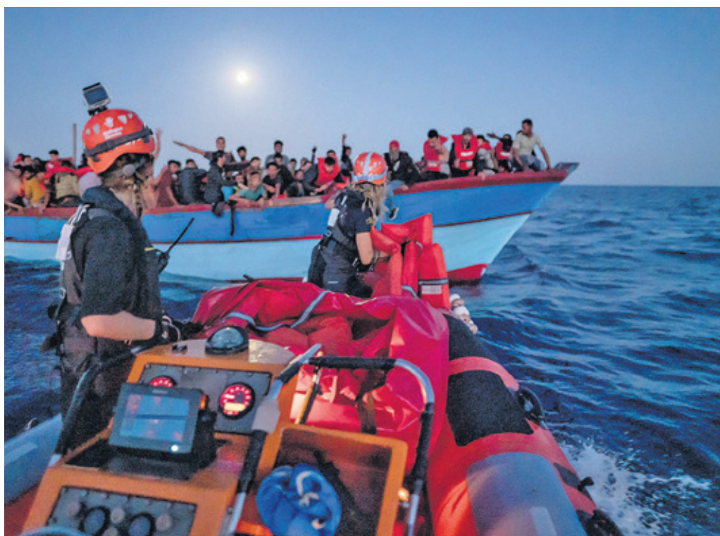
Eine der Seenotrettungen der «Sea-Eye 4» im Juni 2022. Auf dem Holzboot sind 290 Menschen an Bord, die meisten nicht sichtbar, weil sie sich im Inneren befinden.