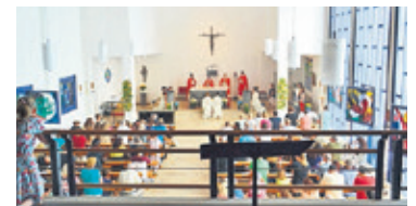
Blick von der Empore.