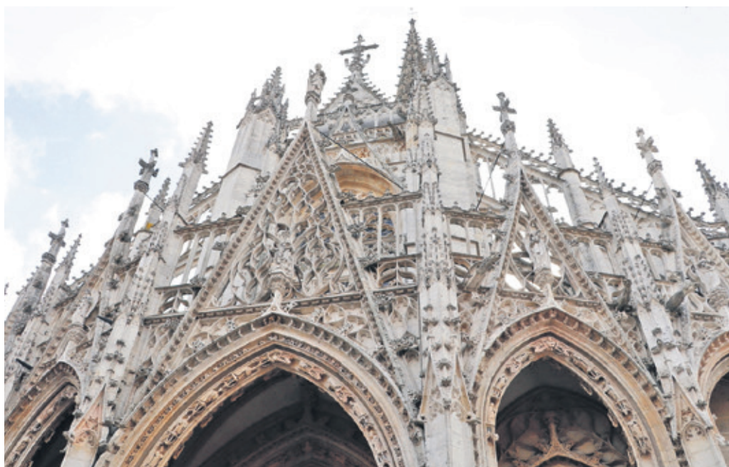
Das Fragment der Kathedrale in Beauvais.