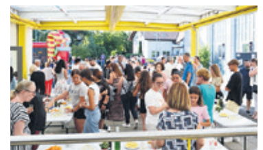
Austausch beim Apéro.

Herzlichen Dank an alle, die zum guten Gelingen dieses unver- gesslichen Festes beigetragen haben.