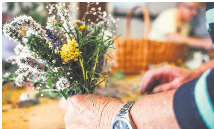
Ein etwas anderer Zugang zu Gott. Kräuterstrauss zu Maria Himmelfahrt.