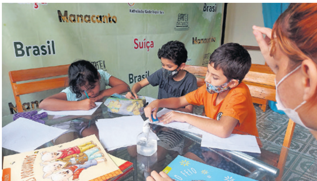
Kreative Kinder im Kulturzentrum Larte Manaus, aus Bern unterstützt durch einen Freundeskreis und die Katholische Kirche Region Bern.