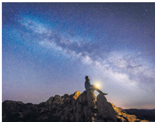
Unsere Galaxie, die Milchstrasse. Vieles ist erklärbar, staunen darf man immer.

Wer am Morgen die Augen aufschlägt, nimmt eine Vielzahl von Dingen – Farben, Formen, Bewegungen – wahr. Und alle anderen Sinne ermöglichen weitere, ergänzende Eindrücke über das «Draussen» des eigenen Selbst. Auch der Blick nach innen ist jedoch Teil der Weltwahrnehmung, zumal es beim Betrachten der Wirklichkeit keinen Beobachtungsposten gibt, von dem aus man objektiv und unbeteiligt auf das grosse Ganze sehen könnte.