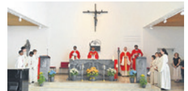
Sinto feiert die Heilige Messe.