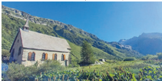
Kapelle in Gletsch (Furka/Grimselpass).