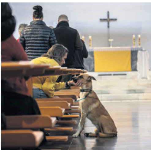
Am 2. Oktober mutete die Berner Pfarrei Bruder Klaus ...

Von Marcel Friedli