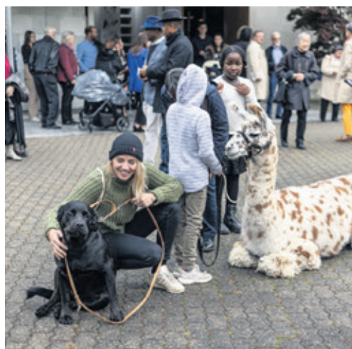
... fast wie die Arche Noah an.