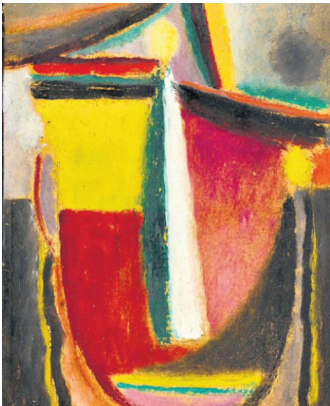
Abstrakter Kopf. Alexej von Jawlensky, Öl auf Holz 1922, Privatbesitz.

In den Klagepsalmen bringen Menschen ihr ganzes Leid, ihre Not, ihren Schmerz und ihre Verzweiflung vor Gott: