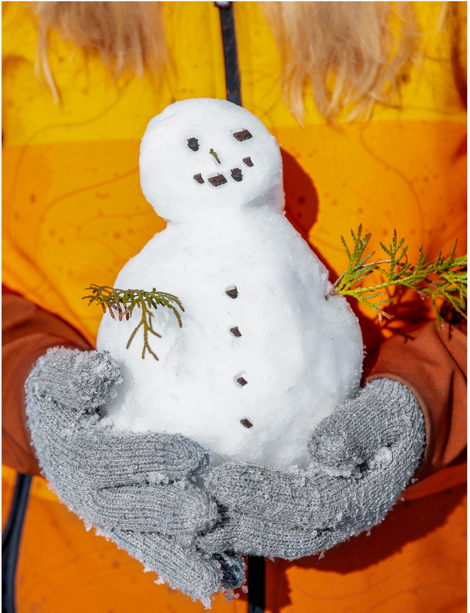
Fallen lassen oder sich darum kümmern ...