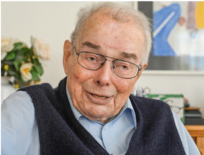
Anton Cadotsch (1923–2023): ein Strippenzieher, der etwas bewegen wollte.

Vikar in Bern, Subregens in Luzern, Religionslehrer in Solothurn, Präsident der Synode 72, Sekretär der Schweizer Bischofskonferenz, Generalvikar des Bistums Basel, Domherr von Solothurn und Dompropst der Diözese Basel: Anton Cadotsch hatte viele bedeutende Kirchenämter inne, wirkte im Spannungsfeld des Zweiten Vatikanischen Konzils und der 1968er-Bewegung. Der promovierte Theologe feierte 2020 das 70-Jahre-Jubiläum als Priester, erlebte die Reformen und die Zeit des Umbruchs hautnah mit. Dabei setzte er sich aktiv für die Kirche, die Ökumene und den interreligiösen Dialog ein. Er war ein Strippenzieher und wollte etwas bewegen. Trotz wichtigen Positionen blieb Anton Cadotsch immer Mensch. Er spielte Klavier, Orgel und Oboe, besuchte Konzerte im In- und Ausland. Die Liebe zur Musik und zur Geselligkeit, sein Mutterwitz und Schalk machten ihn nahbar. Wie die Anekdote, die er gern erzählte: als Studenten ihn am Priesterseminar fragten, ob sie ihn mit Professor oder Doktor ansprechen soll-