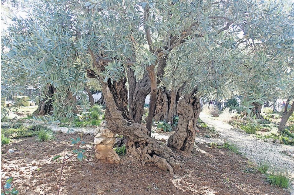
Der Olivenbaum symbolisiert Frieden, Weisheit und Hoffnung.