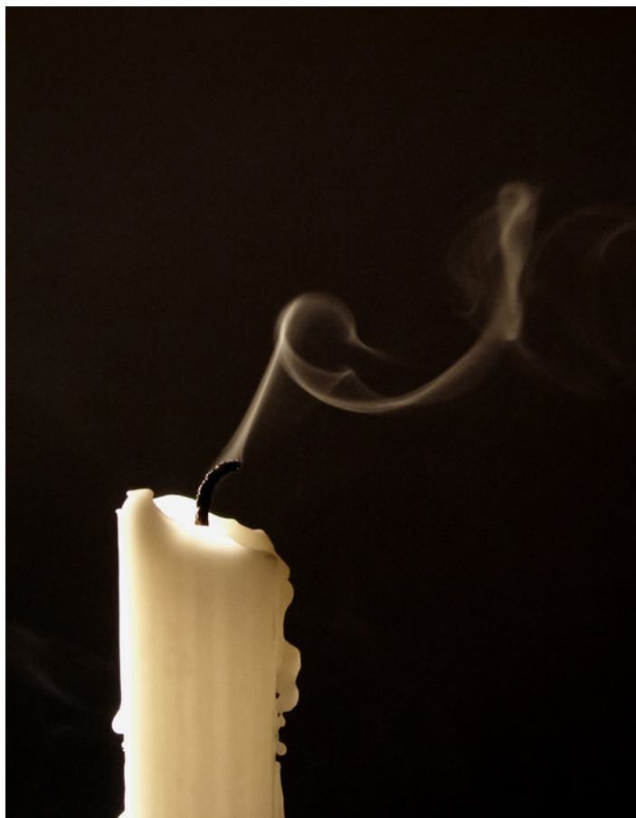
Umkehr und Busse fordert Bischof Felix von seiner Kirche, damit Neubeginn gelingen kann.

Er höre dabei folgenden Grundtenor: «So kann es mit der Institution Kirche nicht weitergehen.» Er teile diese Einschätzung, so der Bischof. «Wir brauchen einen Wandel. In der Sprache der Bibel heisst das Umkehr. Unsere Kirchengemeinschaft braucht Umkehr und Busse.»