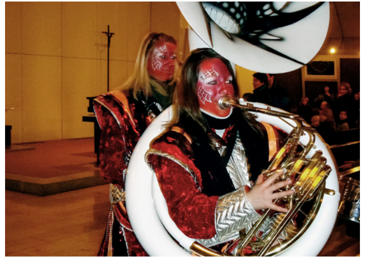
Samstag, 27. Januar um 18.00, kath. Kirche Münsingen