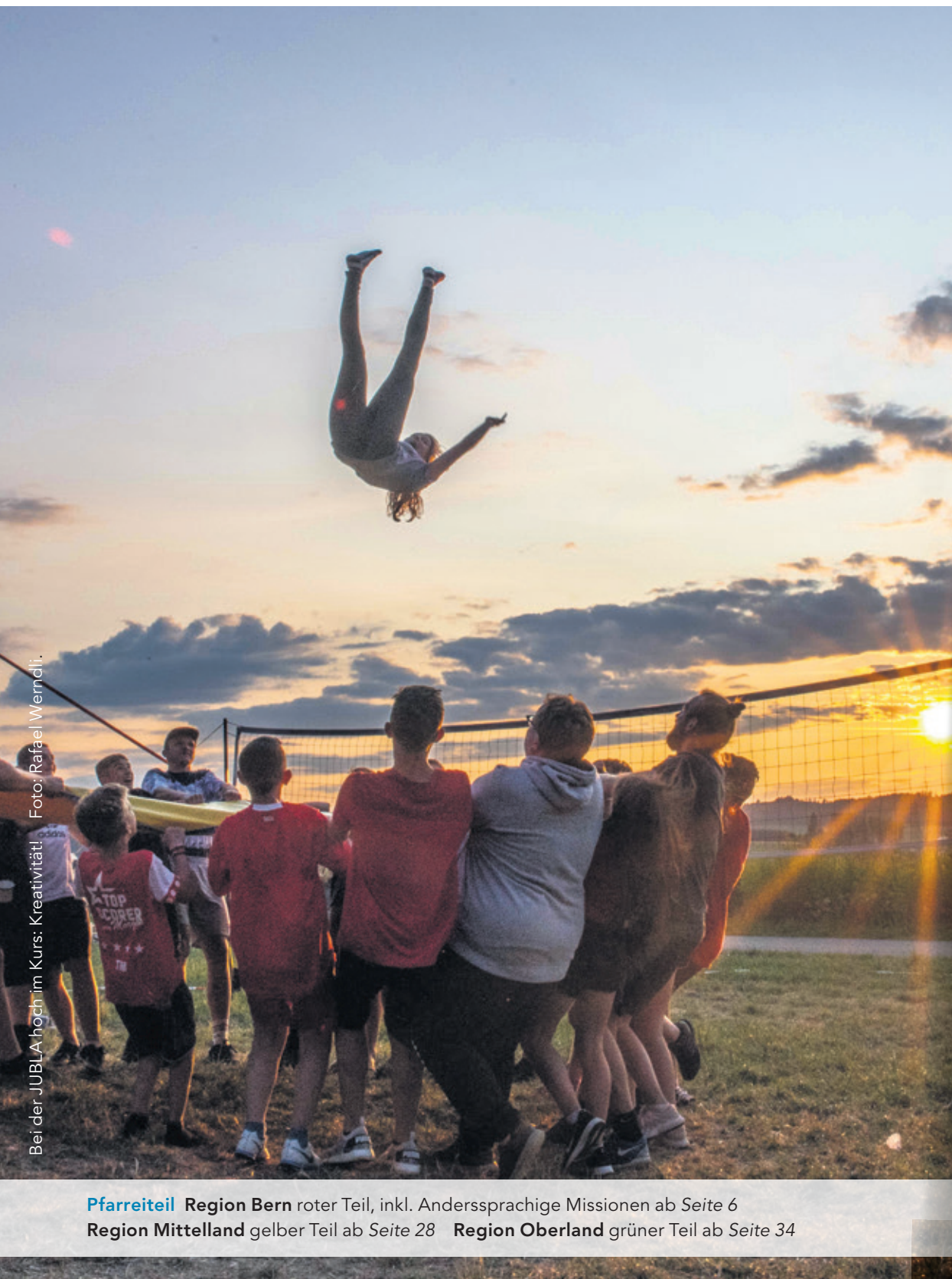
Bei der JUBLA hoch im Kurs: Kreativität!

Pfarreiteil Region Bern roter Teil, inkl. Anderssprachige Missionen ab Seite 6 Region Mittelland gelber Teil ab Seite 28 Region Oberland grüner Teil ab Seite 34