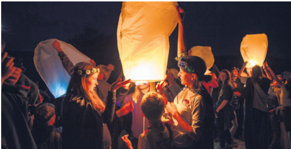
Die JUBLA lebt Kirche und feiert besondere Momente: Ein Meer von Lichtern steigt in den Himmel (kantonales Sommerlager 2019).

Text: Monika Dillier, Kantonspräses JUBLA Bern