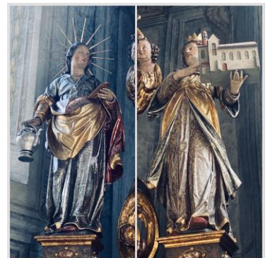
Das Innere Kapelle kann bei Stadtführungen oder bei Kirchenanlässen besichtigt werden.